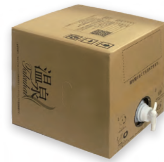
20ℓBOX/選んだ温泉をご購入