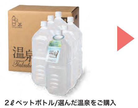
2ℓペットボトル/選んだ温泉をご購入