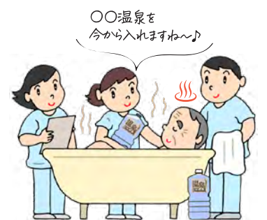
そのまま入浴時に投入