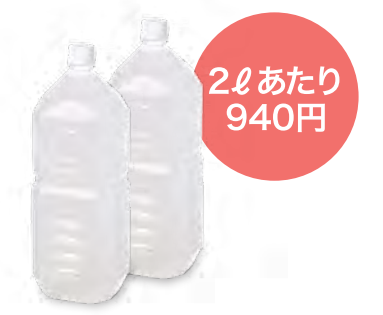
2ℓペットに移し替え、1~2本浴槽に。